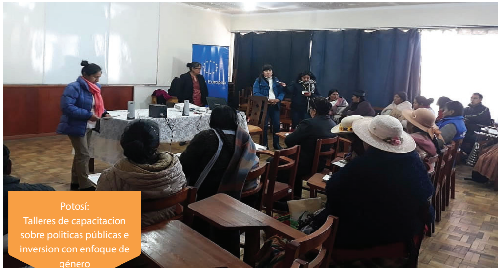
Potosí: Talleres de capacitación sobre políticas públicas e inversión con enfoque de género

El 7 de agosto, a través de la Plataforma de Justicia Fiscal desde las mujeres departamental Potosí, se fortalecieron los conocimientos de sus integrantes en el Taller sobre políticas públicas e inversión municipal con enfoque de género. Además se han socializado las agendas trabajadas desde las mujeres. Han participado representantes de la Asociación de Concejalas de Potosí - ACOP.