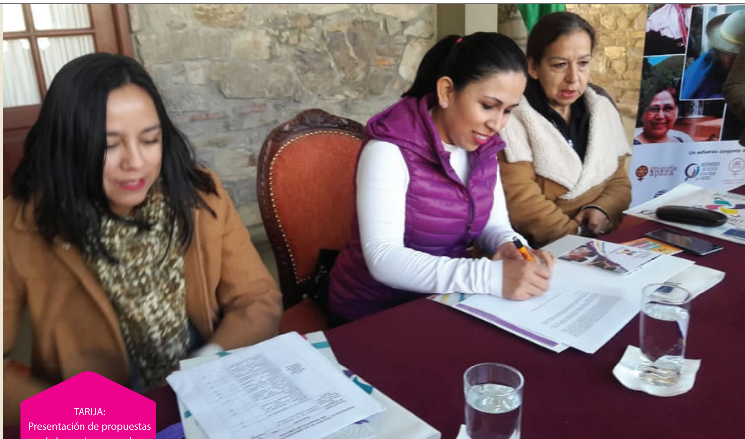
TARIJA: Presentación de propuestas de las mujeres para la inclusión al POA 2019.