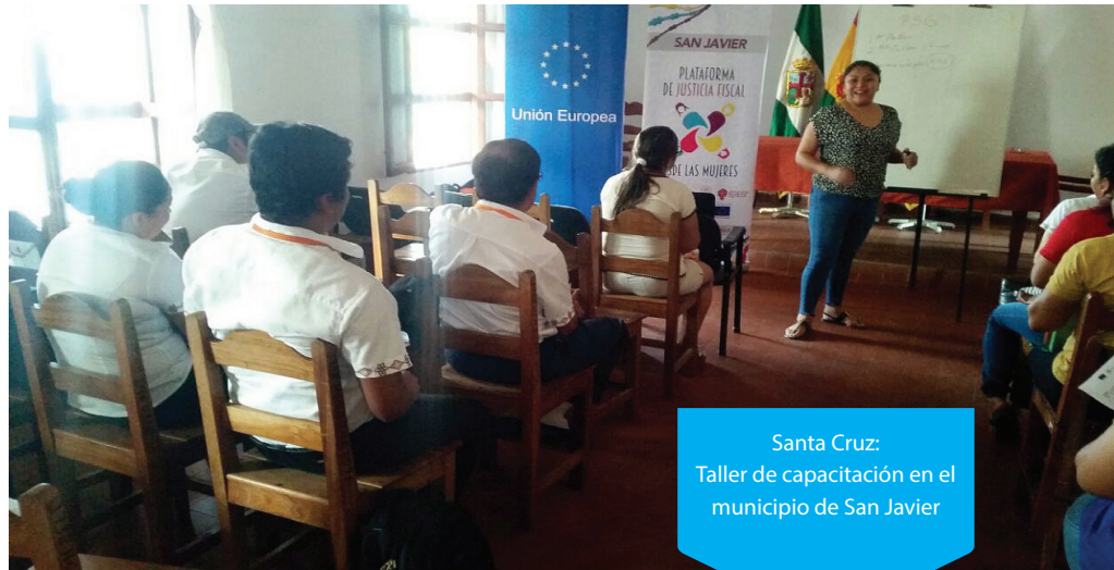
Santa Cruz: Taller de capacitación en el municipio de San Javier

El 10 de septiembre, a través la Casa de la Mujer, que forma parte de la Plataforma de Justicia Fiscal desde las mujeres, en Santa Cruz se llevó adelante el Taller sobre presupuestos con enfoque de género en San Javier. Los mismos se constituye en espacios de información y debate. Se tienen planificado dos espacios de capacitación, donde se analizarán también las propuestas de las mujeres para la mejor implementación de las propuestas.