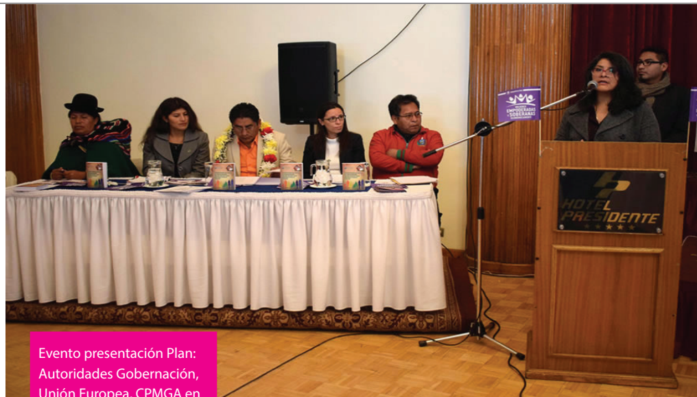
Evento presentación Plan: Autoridades Gobernación, Unión Europea, CPMGA en Hotel Presidente - La Paz

La Jefa de la Delegación de la Unión Europea, Mertixell Giménez, felicitó a las organizaciones de la sociedad civil, a las organizaciones de mujeres y a la Gobernación Departamental de La Paz por contar con un Plan